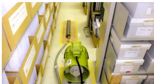
古文書庫の中にガスを送り込む

令和2年度はこの作業のため、5月28日(木)～6月3日(水)まで休館し、皆様にはご迷惑をおかけいたしました。今後も定期的なくん蒸のため休館となることもありますが、資料を良好な状態で後世に伝えていくために、ご理解とご協力をお願いいたします。(くん蒸業務は株式会社東日本消毒に委託しました。)